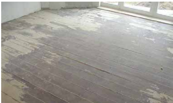
vorher: unansehnlich und verschmutzt

Fragen Sie in einem unserer 45 Parkettstudios unverbindlich an!