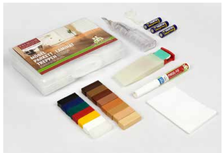
für versiegeltes Parkett & Laminat