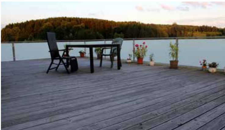
vorher: Grauschleier und Verschmutzungen

Anschließend schützen wir Ihr Holz auf Wunsch mit unserem Spezialöl für Terrassen oder pflegen Ihren Parkettboden neu ein. Wenn Reinigen nicht mehr ausreicht, können wir Ihnen auch eine komplette Überarbeitung anbieten!