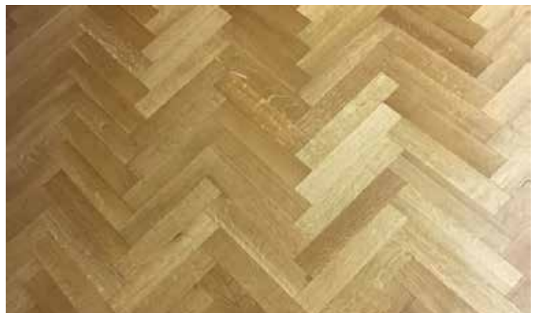
nach dem Refreshing: wirkt fast wie neu