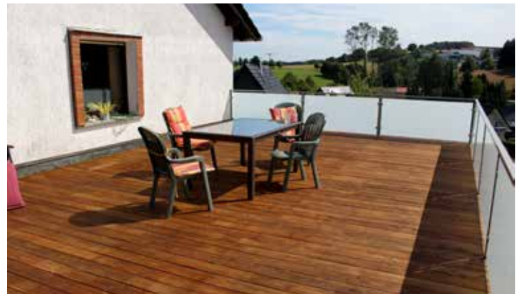
nachher: porentief sauber und frisch geölt