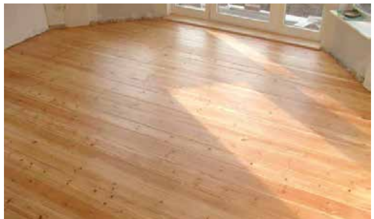
nachher: der Boden strahlt, wie neu