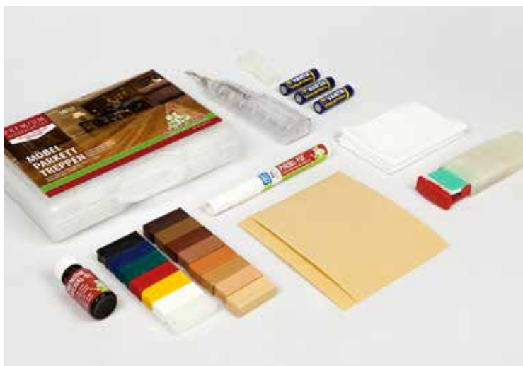
für geöltes Parkett