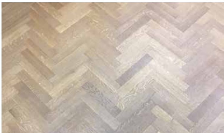
vor dem Refreshing: stumpf und farblos

Ihr Parkettboden erhält eine Behandlung mit einer Einscheibenmaschine und anschließender professioneller Nachbehandlung.